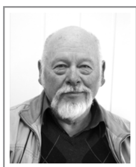
Helge Harald S r 